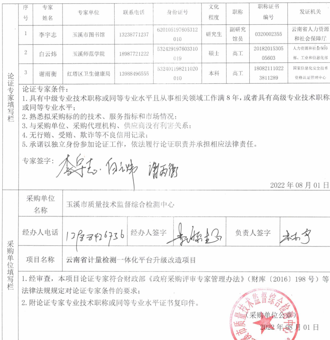
政府采购项目单一来源采购论证专家资格审查表